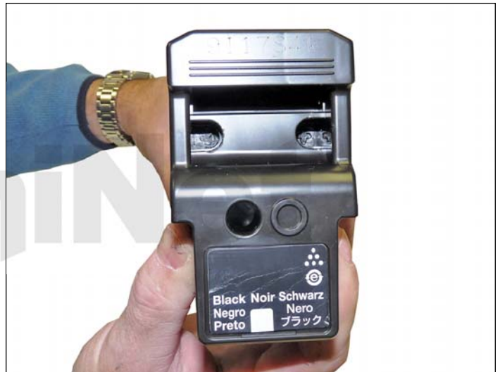
7. Instale la cubierta lateral en el cartucho. Una manera sencilla de realizar este procedimiento es colocar cuatro gotas de pegamento caliente en los cuatro postes rotos. Rápidamente coloque la cubierta lateral antes de que el pegamento se seque. Si requiere ayuda para mantener la cubierta lateral en su sitio, una cinta negra a lo largo del borde funcionara bien.