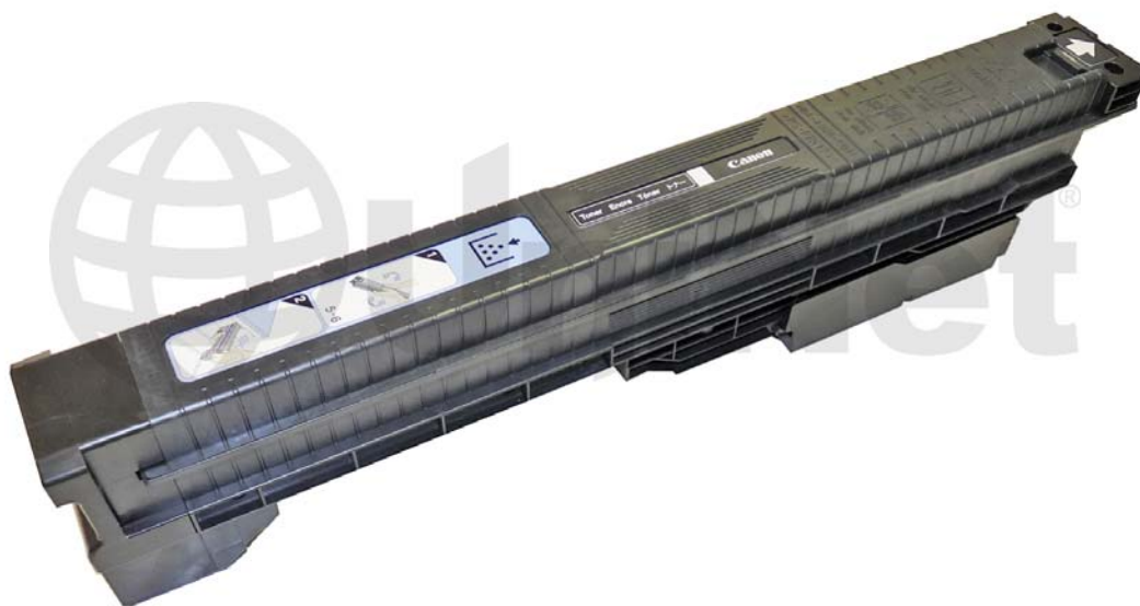
CARTUCHO DE TÓNER CANON IMAGERUNNER C3200