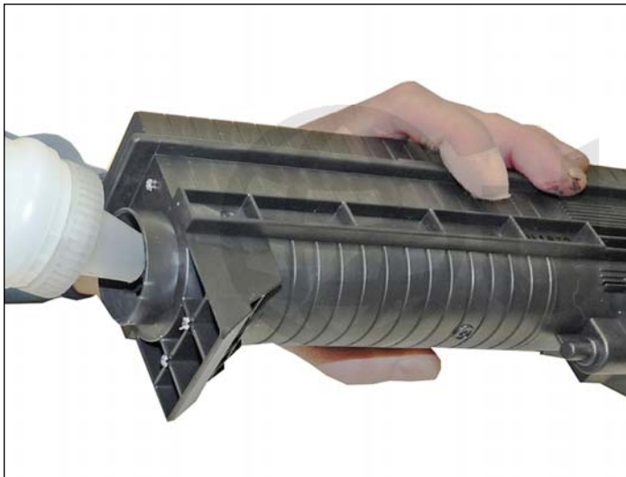
6. Llene la cavidad con tóner Canon C3200 nuevo y coloque el tapón de llenado.