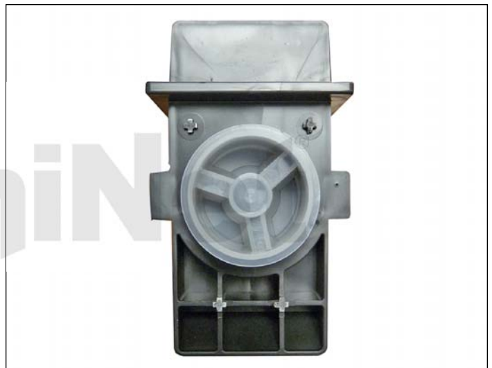
5. Remueva el tapón de llenado y limpie todo el tóner de desperdicio.