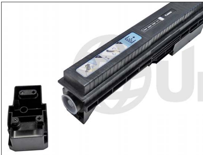
4. Remueva la cubierta lateral.